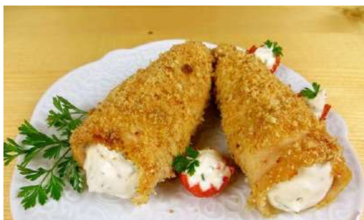
Трубочки из куриного филе с сырным кремом