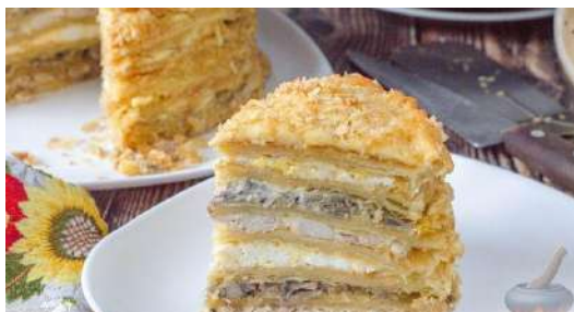
Закусочный торт "Наполеон" с курицей и грибами