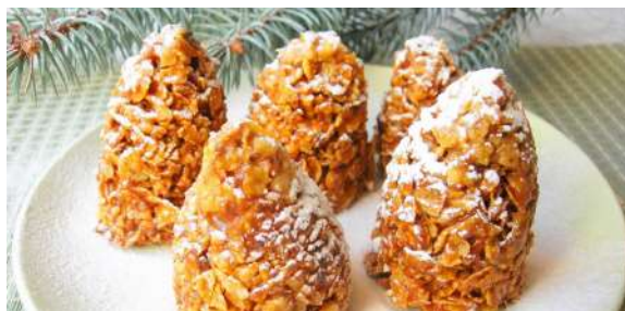
Десерт "Еловые шишки"