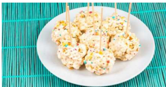
Конфеты из попкорна