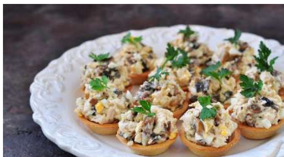
Жульен с грибами и курицей в тарталетках