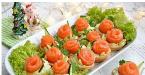
Тарталетки с красной рыбой, огурцом и сливочным сыром